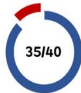
Ecart de rémunération